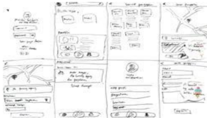
Gambar 2. Crazy 8

Pada tahap kedua ini dilakukan proses brainstorming dengan menggunakan teknik crazy 8 yang dilakukan oleh peneliti. Adapun hasil yang didapatkan dibagi menjadi dua yaitu dari sisi customer dan sisi mekanik. Adapun hasil yang didapatkan adalah sebagai berikut ;