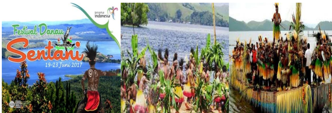
Gambar 4. Festival Budaya dan Olahraga Air Danau Sentani

Berdasarkan data temuan di lapangan selanjutnya dapat dilakukan analisis menggunakan teknik S.W.O.T dalam mengkaji potensi destinasi wisata budaya dan olahraga Danau Sentani Kabupaten Jayapura Provinsi Papua seperti berikut: