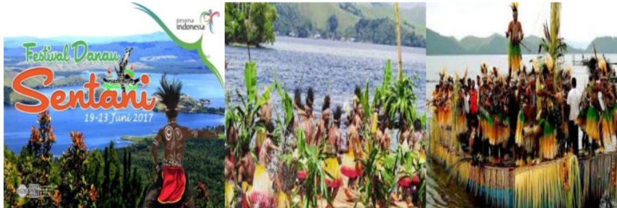
Gambar 4. Festival Budaya dan Olahraga Air Danau Sentani

Berdasarkan data temuan di lapangan selanjutnya dapat dilakukan analisis menggunakan teknik S.W.O.T dalam mengkaji potensi destinasi wisata budaya dan olahraga Danau Sentani Kabupaten Jayapura Provinsi Papua seperti berikut: