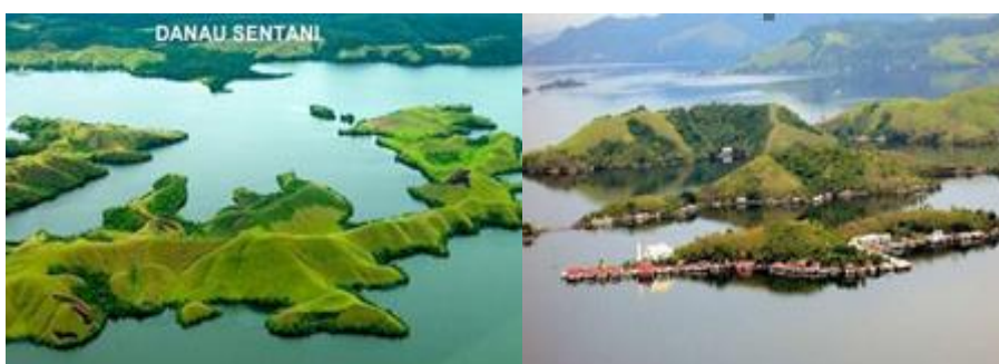
Gambar 2. Keadaan Aktual Citra Wisata Danau

Wabah tidak selamanya menjadi persoalan terus menerus, hal ini memberikan jalan keluar lainnya yakni dengan pemanfaatan media sosial dan ruang digital untuk semakin mengenalkan Danau Sentani kepada masyakat luas. Selanjutnya, dengan mulai dilonggarkannya aturan status kewaspadaan Covid-19 atau dimulainya kehidupan ( new normal era ) kawasan destinasi tersebut melalui kembali dibuka dan ramai mengundang kembali pengunjung melalui sarana promosi. Hasilnya adalah peningkatan signifikan masyarakat berkunjung ke Danau Sentani terlebih bersamaan dengan event nasional yakni PON (Pekan Olahraga Nasional) dan Peparnas (Pekan Paralimpik Nasional) memberikan dampak peningkatan luar biasa dalam hal ekonomi dan kesejahteraan masyarakat. Berikut adalah eksisting destinasi pilihan kawasan wisata Danau Sentani: