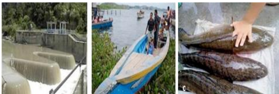
Gambar 3. Kondisi Eksisting Beberapa Fungsi Pemanfaatan Danau Sentani