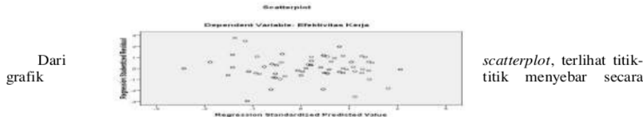
Gambar 4.3 Hasil Pengujian Heteroskedastisitas

19 tidak ada variabel bebas yang memiliki nilai kurang dari 10% atau 0,1. Hal ini berarti bahwa variabel-variabel penelitian ini menunjukkan tidak adanya gejala multikolinieritas.