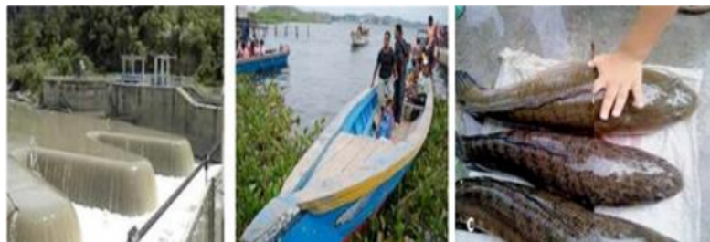
Gambar 3. Kondisi Eksisting Beberapa Fungsi Pemanfaatan Danau Sentani