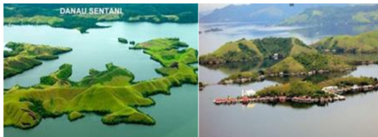
Gambar 2. Keadaan Aktual Citra Wisata Danau

Wabah tidak selamanya menjadi persoalan terus menerus, hal ini memberikan jalan keluar lainnya yakni dengan pemanfaatan media sosial dan ruang digital untuk semakin mengenalkan Danau Sentani kepada masyarakat luas. Selanjutnya, dengan mulai dilonggarkannya aturan status kewaspadaan Covid-19 atau dimulainya kehidupan ( new normal era ) kawasan destinasi tersebut melalui kembali dibuka dan ramai mengundang kembali pengunjung melalui sarana promosi. Hasilnya adalah peningkatan signifikan masyarakat berkunjung ke Danau Sentani terlebih bersamaan dengan event nasional yakni PON (Pekan Olahraga Nasional) dan Pepamas (Pekan Paralimpik Nasional) memberikan dampak peningkatan luar biasa dalam hal ekonomi dan kesejahteraan masyarakat. Berikut adalah eksisting destinasi pilihan kawasan wisata Danau Sentani: