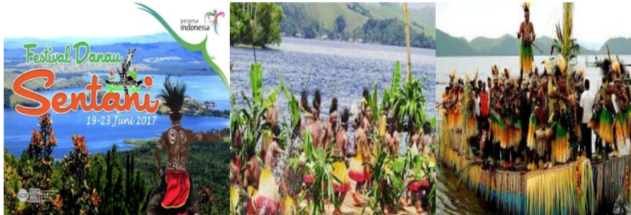
Gambar 4. Festival Budaya dan Olahraga Air Danau Sentani

Berdasarkan data temuan di lapangan selanjutnya dapat dilakukan analisis menggunakan teknik S.W.O.T dalam mengkaji potensi destinasi wisata budaya dan olahraga Danau Sentani Kabupaten Jayapura Provinsi Papua seperti berikut: