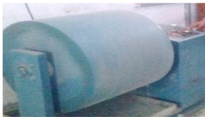
Gambar 4. Pengujian Cantabro

Pengujian cantabro dilakukan untuk mengetahui daya ikat dari bitumen terhadap pelepasan butir pada campuran beraspal dengan mesin Los Angeles. Benda uji dimasukkan ke mesin Los Angeles tanpa bola baja. Mesin Los Angeles kemudian dijalankan dengan kecepatan antara 30-33 rpm sebanyak 300 putaran.