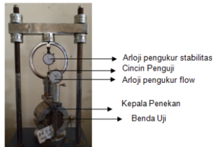
Gambar 2. Alat Pengujian Marshall