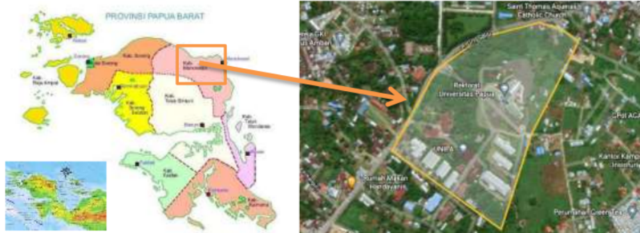
Gambar 1. Lokasi Studi

Metode pengumpulan data adalah teknik atau cara yang dilakukan oleh peneliti untuk mengumpulkan data. Pengumpulan data dilakukan untuk memperoleh informasi yang dibutuhkan dalam rangka mencapai tujuan penelitian. Sementara itu instrumen pengumpulan data merupakan alat yang digunakan untuk mengumpulkan data. Karena berupa alat, maka instrumen pengumpulan data dapat berupa check list , kuesioner, pedoman wawancara, hingga kamera untuk foto atau untuk merekam gambar. Metode pengumpulan data terbagi berdasarkan jenis datanya yaitu data primer dan sekunder, maka pengumpulan data pada penelitian kali ini terbagi menjadi 2 yaitu pengumpulan data primer dan sekunder.