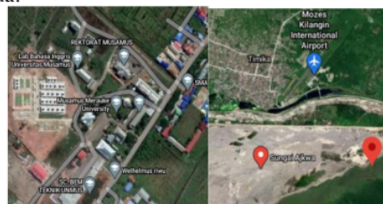
Gambar 1. Lokasi Pengambilan sampel tanah (kiri), lokasi pengambilan sampel tailing (kanan)

Pengambilan sampel material tanah berlokasi di daerah sekitar Universitas Musamus, Rimba Jaya, Kabupaten Marauke, Provinsi Papua dan pengambilan material tailing berlokasi di Sungai Ajkwa Kabupaten Mimika, Provinsi Papua sebagai studi kasus dalam penelitian ini. kemudian Pengujian pada penelitian ini dilaksanakan di Laboratorium Mekanika Tanah Program Studi Teknik Sipil Universitas Yapis Papua.