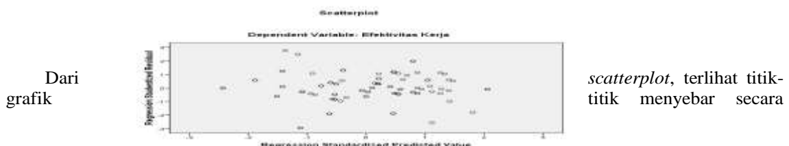
Gambar 4.3 Hasil Pengujian Heteroskedastisitas