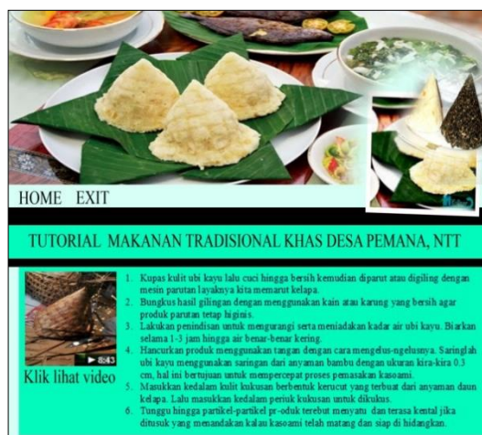
Gambar 6. Tampilan tutorial makanan

Tampilan halaman ini adalah menjelakan tentang bagaimana cara pembuatan makanan kasoami