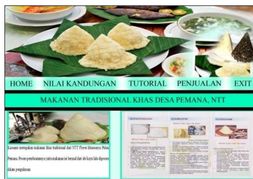
Gambar 3. Tampilan awal makanan

Tampilan menu ini merupakan tampilan home pada aplikasi MENIKAM