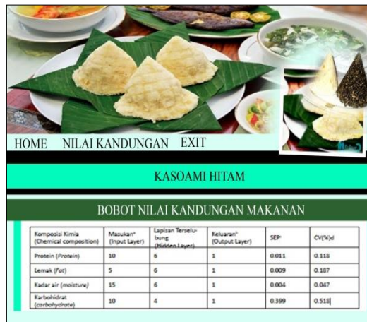
Gambar 4. Tampilan nilai kandungan makanan

Tampilan halaman ini merupakan tampilan hasil perhitua bobot dalam memprediksi nilai kandungan maknan