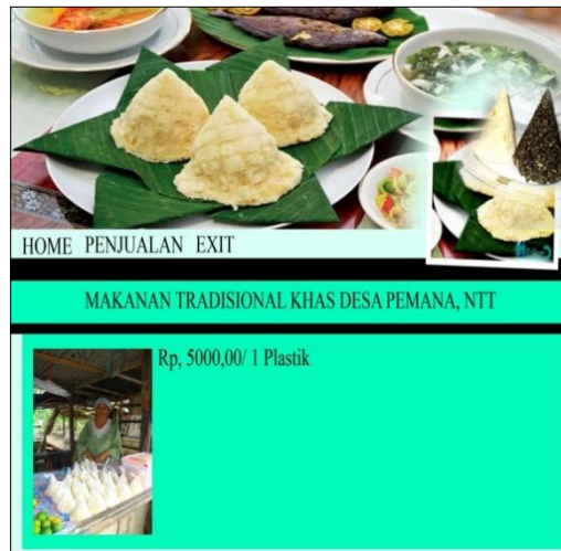
Gambar 5. Tampilan penjualan makanan

Tampilan halaman ini adalah untuk melakukan suatu penjualan makanan tradisional